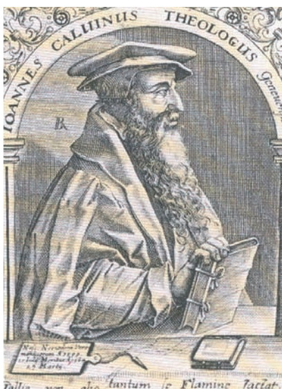
Ιωάννης Καλβίνος. Χαλκογραφία, 16ος αι.

Ο Καλβίνος έζησε στη Γαλλία και στην Ελβετία. Τις θέσεις του τις γνωρίζουμε από το έργο «Χριστιανική Διδασκαλία». Εκεί περιέχεται η άποψη ότι η Αγία Γραφή δεν είναι μόνο ένα θεόπνευστο βιβλίο αλλά ένα κείμενο-κανόνας, με βάση το οποίο ελέγχεται κάθε χριστιανική διδασκαλία και πράξη. Η σταυρική θυσία του Χριστού έγινε μόνο για τους προορισμένους από την αρχή του κόσμου εκλεκτούς, που έτσι έλαβαν τη θεία χάρη για να σωθούν. Ο Καλβινισμός απομακρύνθηκε αρκετά από το Λουθηρανισμό και αποτέλεσε ιδιαίτερο κλάδο. Διαδόθηκε στην Ελβετία, στις Κάτω Χώρες και στη Σκωτία. Στη Γαλλία επικράτησε η διδασκαλία του Καλβίνου μόνο σε ένα μέρος του πληθυσμού, γιατί αντέδρασαν οι ρωμαιοκαθολικοί ηγεμόνες της.