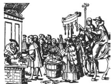
Πώληση συγχωροχαρτιών. Ευλογραφία.