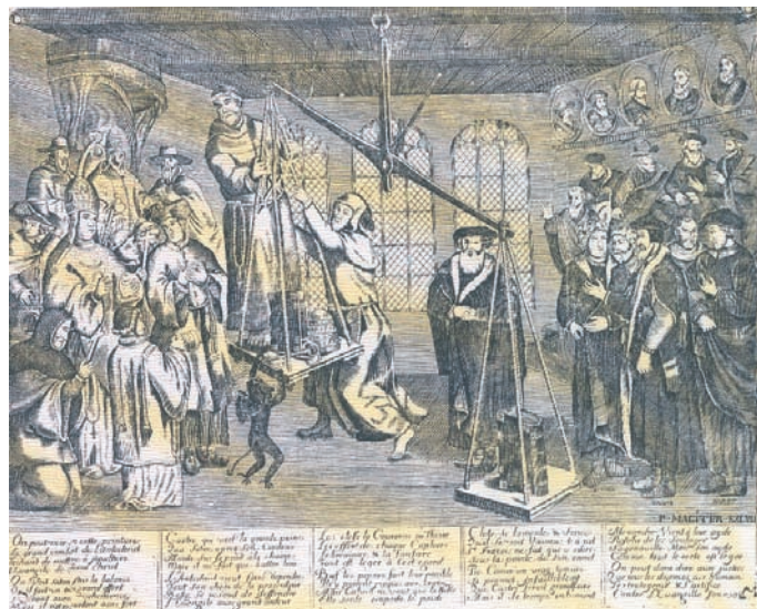
Γαλλική προκήρυξη κατά της Ρωμαιοκαθολικής Εκκλησίας. Στο κέντρο ο Μαρτίνος Λούθηρος.

Το γεγονός αυτό, καθώς και η προσπάθεια για κατά γράμμα εφαρμογή της Αγίας Γραφής, μετέβαλε τη Μεταρρύθμιση από ενθουσιώδη ιδεολογία και έκφραση βιώματος σε αυστηρά οργανωμένο τρόπο ζωής. Αυτό, βέβαια, αποδείχθηκε αναγκαίο για την επιβίωσή της μέσα στα σκληρά ιστορικά γεγονότα που τη διαμόρφωσαν.