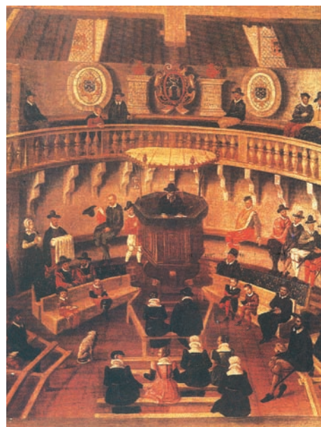
Θ. Λειτουργία Καλβινιστών στη Λυών. 16ος αι.

Ένας νέος θεσμός θεσπίστηκε από τον Καλβίνο στην Εκκλησία της Γενεύης, ο θεσμός του προεσβυτερίου. Φαίνεται ότι ο Καλβίνος ταυτίζει τους προεσβυτέρους με τους επισκόπους της Καινής Διαθήκης, στην οποία μερικές φορές οι όροι «προεσβύτερος» και «επίσκοπος» έχουν την ίδια σημασία, αλλά σε καμία περίπτωση δεν συγχέονται οι ρόλοι τους. Σύμφωνα με την συγκεκριμένη αντίληψη του Καλβίνου, επιβάλλεται η ύπαρξη προεσβυτέρων στην Εκκλησία, που μαζί με τους λειτουργούς του λόγου θα πρέπει να μετέχουν στη διακυβέρνησή της. Είναι, δηλαδή, οι προεσβύτεροι η τοπική διοικητική αρχή της θρησκευτικής κοινότητας, ενώ καταργούνται οι επίσκοποι. Τα τοπικά προεσβυτέρια