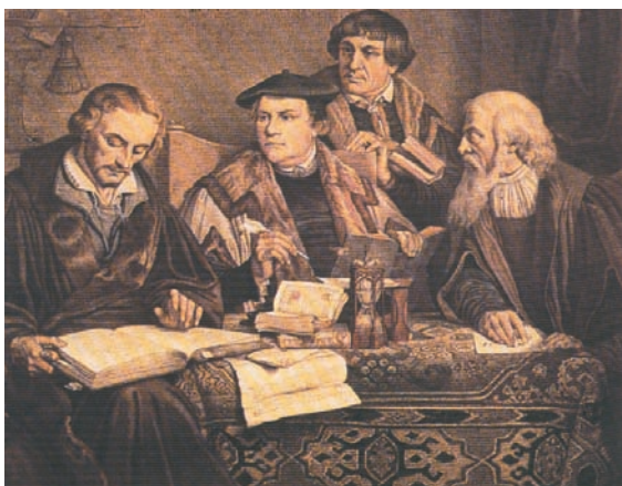
Ο Μαρτίνος Λούθηρος και οι συνεργάτες του.

Ορόσημο στην επικράτηση της Μεταρρύθμισης αποτελεί το έτος 1555, τότε που έγινε η ειρήνη της Αυγούστας. Ύστερα από αντιθέσεις μεταξύ προτεσταντών θεολόγων, αποφασίστηκε να επικρατήσει το μεταρρυθμιστικό δίκαιο στη Γερμανία. Κάθε τοπικός ηγεμόνας είχε το δικαίωμα να επιβάλει τη δική του θρησκεία στην περιοχή του (Cuius regio, ejus religio). Μετά την ειρήνη της Αυγούστας, η Γερμανία χωρίστηκε οριστικά σε περιοχές ρωμαιοκαθολικές και προτεσταντικές.