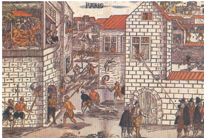
Νύχτα του Αγ. Βαρθολομαίου. 1572. Ξυλογραφία

Η αναταραχή που προκάλεσαν οι νέες ιδέες του Λούθηρου, αλλά και οι σκληροί θρησκευτικοί πόλεμοι που ακολούθησαν, όπως ο Τριακονταετής (1618–1648) συντάραξαν την Ευρώπη. Οι περιοχές της χωρίστηκαν θρησκευτικά σε εκείνες που έμειναν πιστές στον Ρωμαιοκαθολικισμό και στις άλλες που προσχώρησαν στους Προτεστάντες. Ειδικότερα ένα τμήμα της Ευρώπης (Ιταλία, Ισπανία, Αυστρία, Φλάνδρα-Βέλγιο) παρέμεινε Ρωμαιοκαθολικό. Ενώ ένα άλλο τμήμα (βόρεια Γερμανία, Σκανδιναβία, Αγγλία, Ολλανδία) υιοθέτησε τον Προτεσταντισμό. Στη Γαλλία ο αγώνας για την επικράτηση της μιας ή της άλλης πλευράς ήταν αμφίρροπος για πολύ καιρό. Κατέληξε στη σφαγή των Ουγενότων (Γάλλων Προτεστάντων) από τους Ρωμαιοκαθολικούς, το 1572, τη νύχτα του αγίου Βαρθολομαίου, και στην φυγή τους προς την Αμερική. Τα πνεύματα δεν ηρέμησαν παρά στο τέλος του 17ου αι.