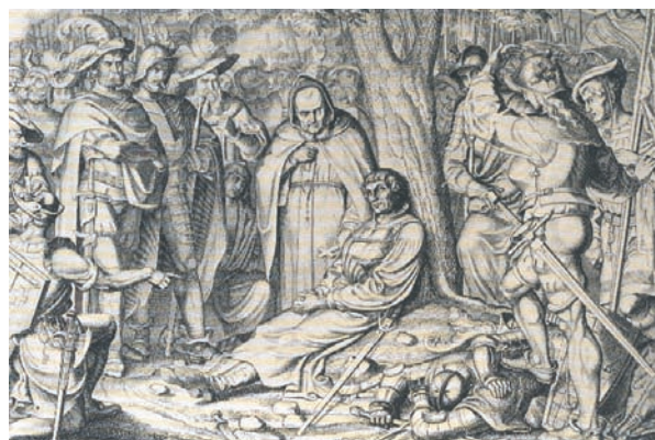
Ο θάνατος του Ζβίγκλιου στο Κάπελ. Από εικονογράφηση βιβλίου του 19ου αι.