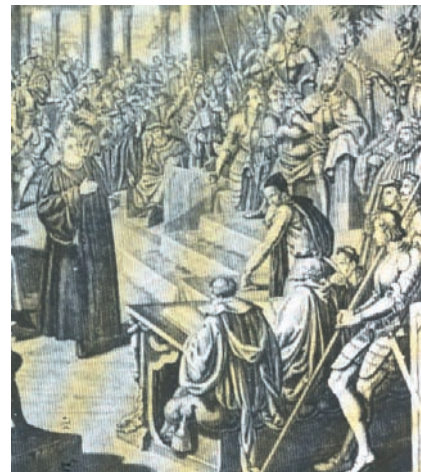
Ο Μαρτίνος Λούθηρος ενώπιον του αυτοκράτορα Καρόλου του Ε' στη Βορμς.