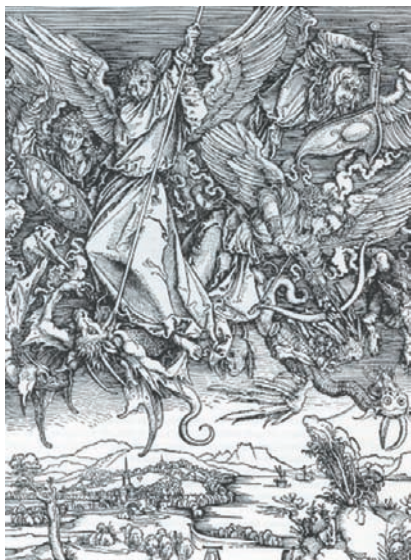
Μιχαήλ, αρχάγγελος της Αποκάλυψης. Έργο του Άλμπρεχτ Ντύρερ.